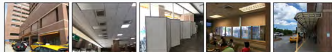
配合夏月各項節電措施