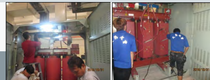
模鑄式變壓器汰舊更新